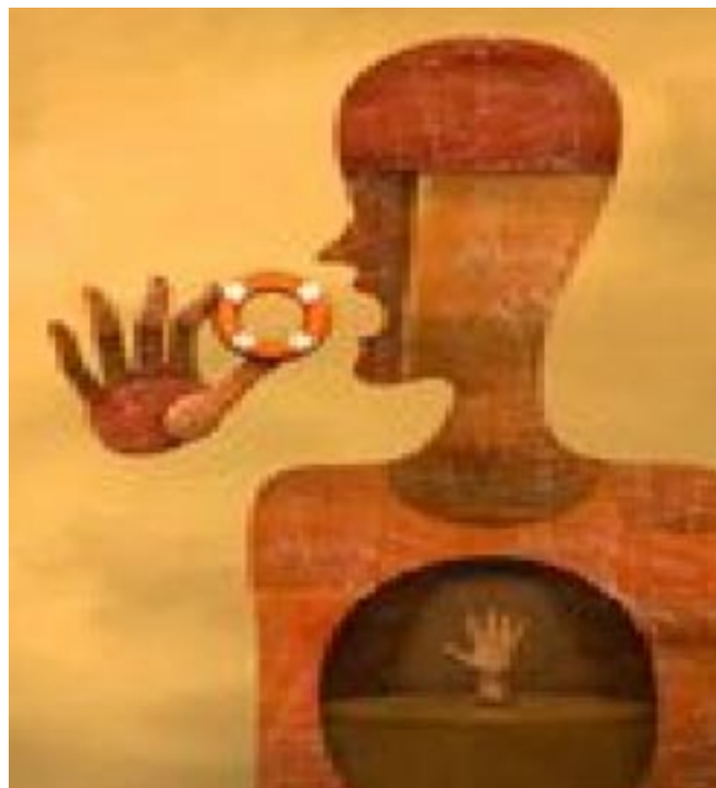
Quando o chão parece fugir debaixo dos pés, há sempre por perto uma mão amiga

Permita-me que lhe diga que você não está sozinho! Estamos aqui bem perto de si. Ao integrar-se no grupo de Auto-Ajuda da Associação, você passa a ser parte de um grupo de pessoas que sabe exactamente o que quer dizer quando fala. Você perceberá, que a maioria dos seus pensamentos não acontecem só consigo. Ainda que os sentimentos variem, os sintomas são similares